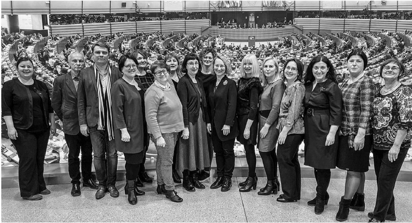
EP deputāte Dace Melbārde (septīta no labās) kopā ar reģionālo mediju žurnālistiem

Kopš 2004. gada, kad Latvija iestājās Eiropas Savienībā (ES), ne mazums arī mūsdienu cilvēku apmeklējuši dažādas starptautiskas institūcijas gan Briselē, gan Strasbūrā, lai iepazītu to darbu. Braukuši skolēni un pensionāri, bibliotekāri un nevalstisko organizāciju pārstāvji, konkursu uzvarētāji... Ar savām prasībām uz Briseli devušies zemnieki. Kā zināms, Eiropas Parlamenta (EP) deputātiem ir pat pienākums uzņemt savas valsts iedzīvotāju grupas, tikties un skaidrot Briselē lemtos, lai ļaunim viņu darbs un lēmumi neliktos kaut kas tāls, bet kļūtu saprotamāks. Vai izdodas, tas jau ir cits jautājums. Taču pamazām attieksme, šķiet, tomēr mainās.